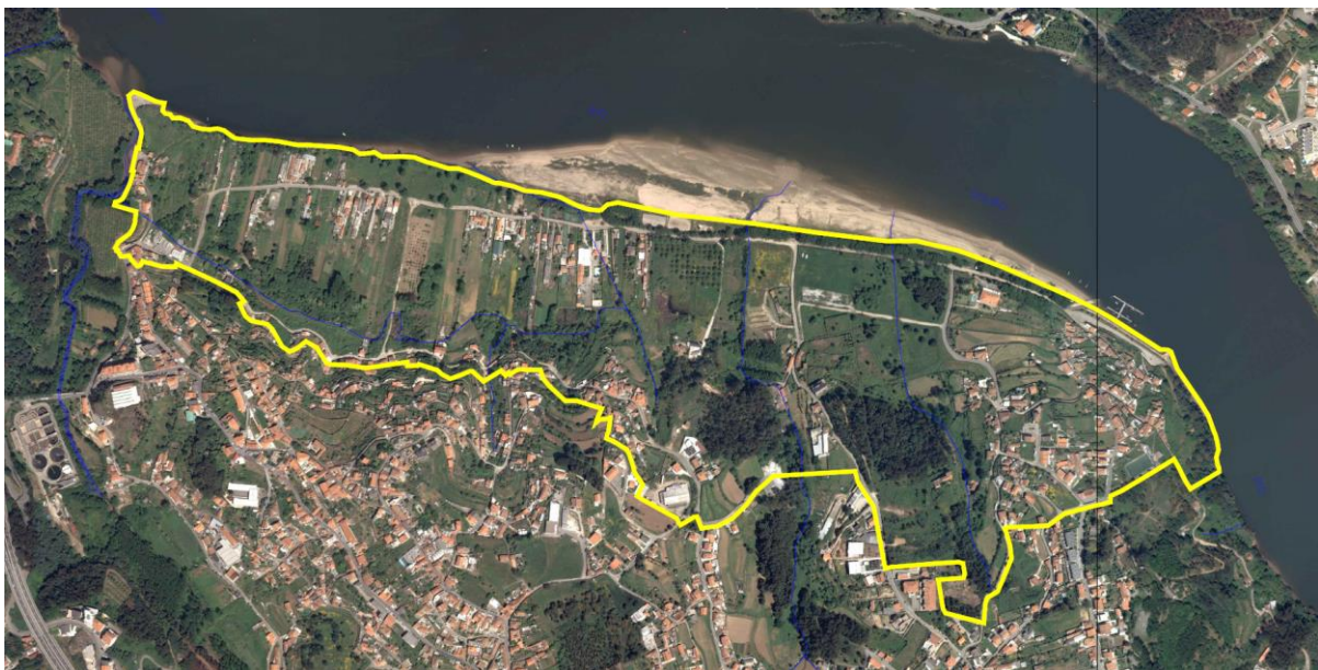
Limite da Proposta de Delimitação da ARU da área envolvente ao Areinho de Avintes e respetivo projeto da ORU

Para esse efeito foi desenvolvida uma proposta de 'Programa Estratégico de Reabilitação Urbana da Operação de Reabilitação Urbana (ORU) da Área Envolvente ao Areinho de Avintes' , abrangendo uma área de intervenção de cerca de 69 hectares, que corresponde a 9% da área da freguesia de Avintes.