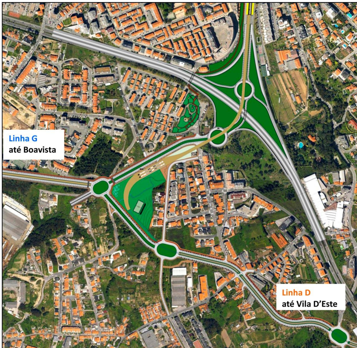
Remodelação Nó de Santo Ovídio e articulação da Avenida até ao Mar com as linhas D e G do Metro, sobre ortofotomapa de agosto de 2008.

Para esse efeito foi desenvolvido um Estudo de Viabilidade, o qual obteve aceitação por parte da EP - Estradas de Portugal, S.A. (EP.EPE), que prevê a manutenção da passagem inferior à autoestrada (A1 / IC2) e a criação de duas rotundas de um lado e do outro daquela, permitindo, através dos ramais de acesso, a implantação de todos os movimentos de ligação à auto-estrada e desta para norte e para sul / poente.