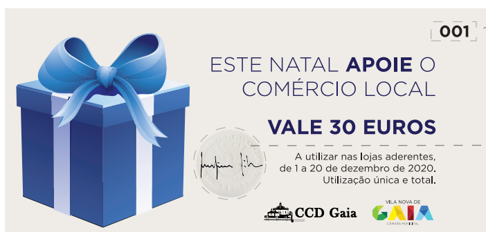
Imagem do voucher