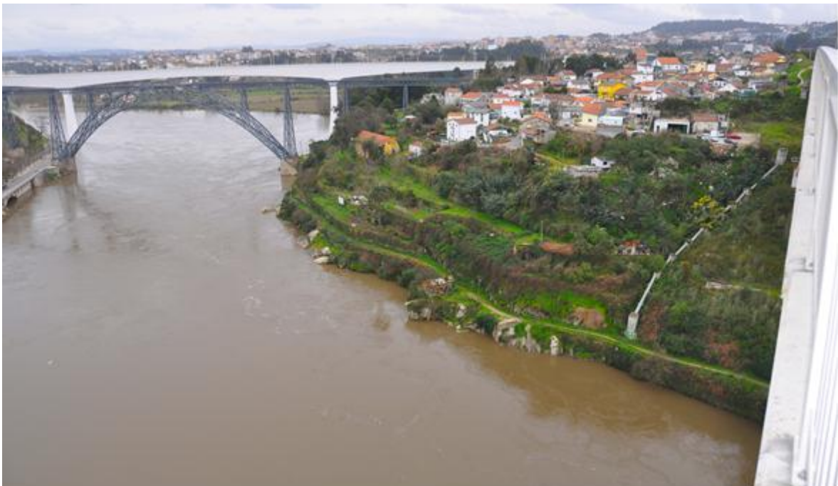
Vista sobre o Percurso entre Pontes, antes da primeira fase de intervenção.

Numa segunda fase de intervenção, já iniciada, foi instalada a rede de iluminação pública e cénica. Prevê-se a construção de redes de drenagem de águas residuais domésticas e pluviais, bem como a correspondente repavimentação e requalificação paisagística de plataformas existentes voltadas para o Rio.