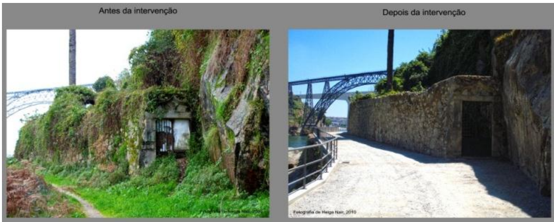
"Percurso entre Pontes" antes e depois da intervenção do Projeto "Encostas do Douro". Na imagem destaque para o portão de acesso ao Rio da Quinta do Vale da Glória e as Pontes D. Maria Pia e S. João.