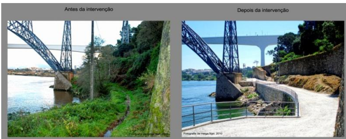
"Percurso entre Pontes" antes e depois da intervenção do Projeto "Encostas do Douro". Na imagem destaque para as Pontes D. Maria Pia e S. João.