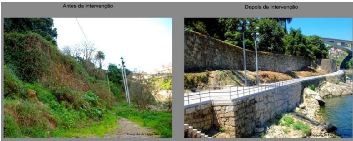
"Percurso entre Pontes" antes e depois da intervenção do Projeto "Encostas do Douro". Na imagem destaque para a requalificação dos muros de suporte das margens do Rio.