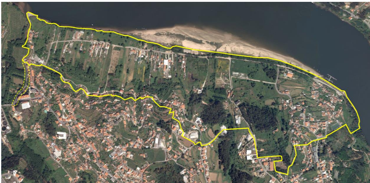
Limite da Proposta de Delimitação da ARU da área envolvente ao Areinho de Avintes e respetivo projeto da ORU A zona a tracejado representa a ampliação da área de intervenção, decorrente da discussão pública.

De seguida procedeu-se à ponderação das participações rececionadas, o que resultou na elaboração do ‘Relatório de Ponderação das participações recebidas no período de discussão pública do Programa Estratégico de Reabilitação Urbana da Operação de Reabilitação Urbana da Área Envolvente ao Areinho de Avintes’, anexo ao processo.