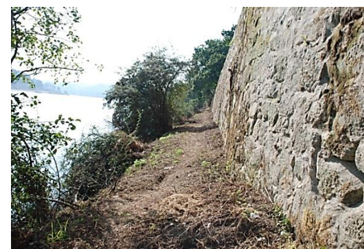
Caminho existente a requalificar