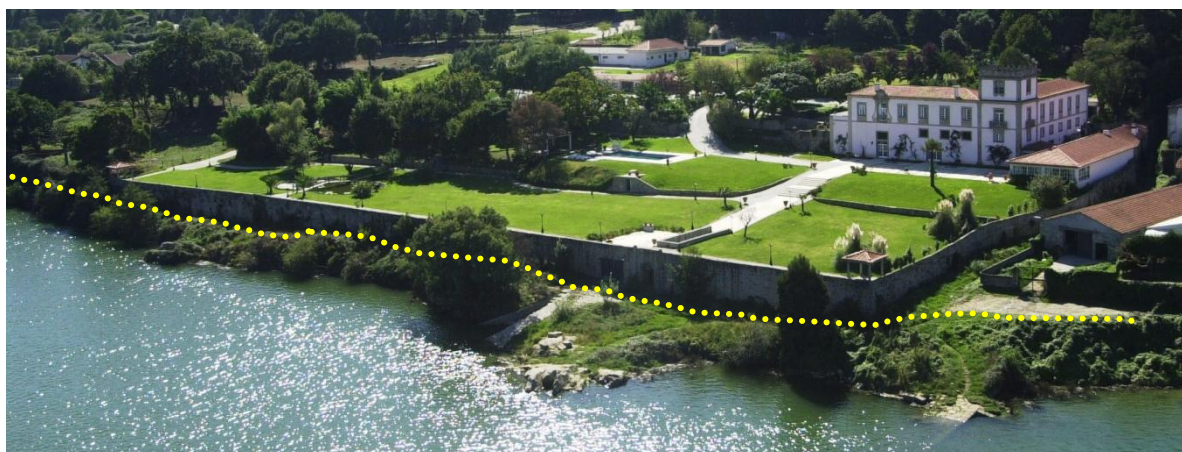
Vista sobre o “percurso entre quintas”, junto à Quinta da Torre Bela ( esquema indicativo )