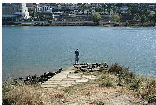
Rampa de acesso ao rio a reconstruir