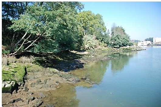
Vegetação ribeirinha a qualificar

Para além das questões ecológicas e cénicas, este percurso é pontuado por elementos patrimoniais absolutamente únicos, todos ligados ao rio e às quintas que se sucedem num contínuo. Este trilho percorre a Quinta da Pedra Salgada, a Quinta da Torre Bela, a Quinta da Carvalheira, a Quinta Fonte da Vinha, a Quinta dos Cubos, a Quinta do Arcediago, a Quinta dos Frades, terminando no Cais do Esteiro, junto à foz do Rio Febras.